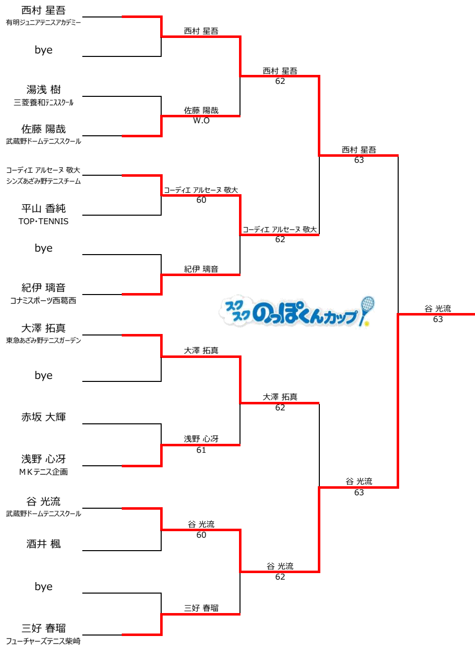
10歳以下1,2位トーナメント