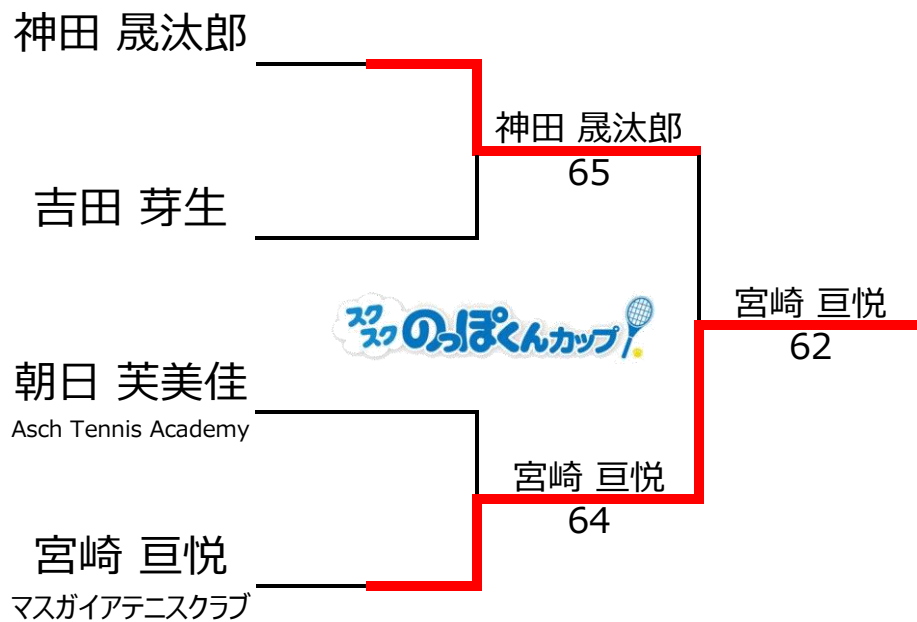
14歳以下1,2位トーナメント