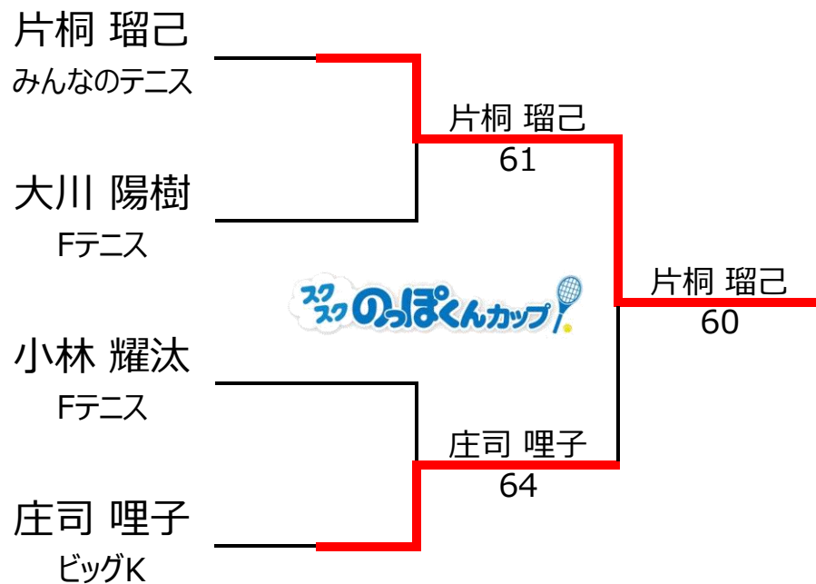
10歳以下3,4位トーナメント